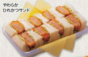
やわらか ひれかつサンド