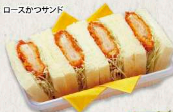
ロースかつサンド