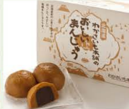
おいしいまんじゅう

※表示価格はすべて税別です。 ※各施設では、特定原材料(乳・卵 小麦・そば・落花生・えび・かに)等 を使ったメニューを調理しており ます。 ※写真はイメージとなります。 また、季節により食材内容等が変 更となる場合がございます。 ※未成年者、お車でお越しの運転者 のお客様へのアルコールのご提供 はしていません。